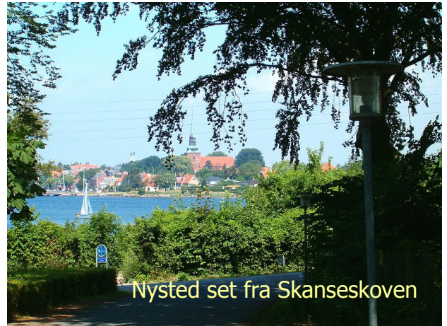
Nysted set fra Skanseskoven

En kultur- og naturtur rundt om byen. Turen er på ca. 5 km., men kan flere steder afkortes. De anvendte stier er af forskellig karakter med græs- eller grusbelægning, og på en kort strækning følges en offentlig vej. Turen egner sig ikke til kørestole og rollatorer.