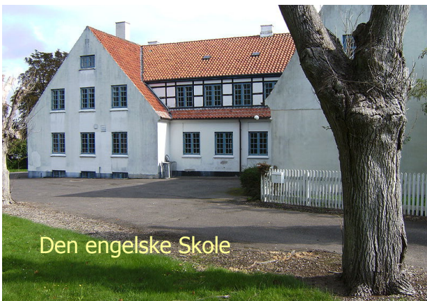
Den engelske Skole

4 - Nysted efterskole blev bygget i 1921 som et børnehjem, men forvandlede til en succesrig efterskole i 1977.