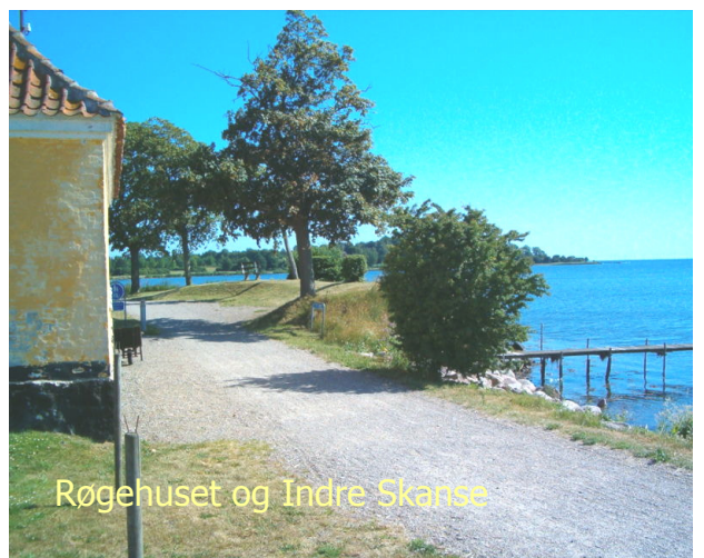
Røgehuset og Indre Skanse

Nysted levede før i tiden af handel, søfart og fiskeri. Nysteds havn var den eneste sikre på en strækning fra Nakskov til Stubbekøbing.